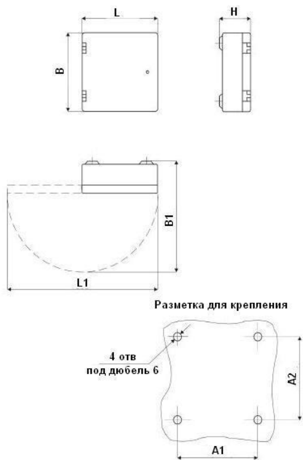
Рис.2. Габаритный чертеж шкафа распределительного настенного ШРН-2/100