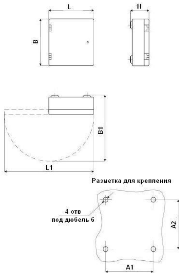
Рис.2. Габаритный чертеж шкафа распределительного настенного ШРН-2/300